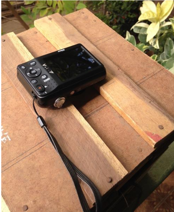
P-Olsen (fósforo) no solo por colorímetro